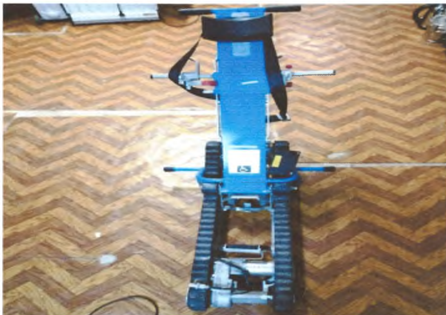
Подъемник для оказания услуг в кабинете водолечения